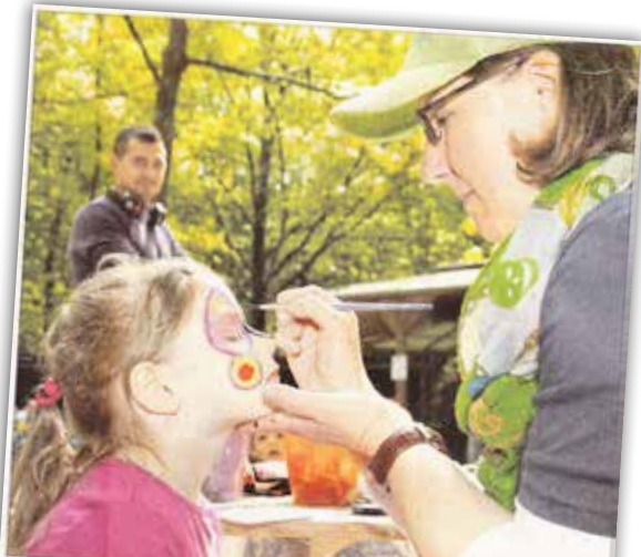
Reden, lachen, Sachen machen ... das Motto des Mütterzentrums fand seine Fortsetzung beim Waldfest zum Muttertag. Die Mütter ließen es sich bei Grillfestern sowie Kaffee und Kuchen gut gehen. So konnte der Nachwuchs sich die Zeit beim Kinderschminken vertreiben. Zurzeit finden beim Mütterzentrum die Vorbereitungen für die Ferienspiele statt. In der Woche vom 7. bis 11. August steht Ballsport, Ragby und eine Fahrradtour auf dem Programm. Die Kindergarten-Gruppe „Mini-Mützen“ ist voll besetzt. Dort kommen die Kleinen unter Anleitung in den „großen“ Kindergarten.