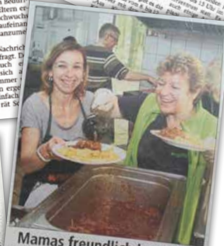
Mamas freundlich bewirtet Hackbraten, Pudding und Currywurst gab es am Sonntag an der Waldfestanlage Hainhausen. Mit ständischen Mienen bewirteten die Frauen des Mütterzentrums ihre Gäste. So mussten Mütter am Muttertag nicht in der Küche stehen, sondern konnten sich bedienen lassen. Bei warmem Maiwetter nutzten viele Gäste diese Gelegenheit. Nach dem vergnügten Start in die Waldfestballon konnte man es sich dann gut gehen lassen. Erst nach der Kaffezeit gab es einen kräftigen Mittagsgang. • ah

Rodgau (red) – Das Mütterzentrum Rodgau bietet auch in diesem Jahr Ferien-Ferenspiele für Kinder im Grundschulalter an. Die Osterferien spielen vom 3. bis 6. April und die Sommerferien vom 8. bis 11. August. Die Spiele finden jeweils von 9 bis 13 Uhr im Mütterzentrum Rodgau statt. Anmeldungen für beide Kurse im Mütterzentrum telefonisch unter Tel. 66 79 69 oder per Mail an info@muetterzentrum-rodgau.de