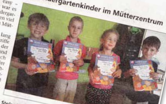
Stolze Teilnehmer des Englischkurses. sprachlerin im Team zu haben. Eine erste Kennenlernstunde findet am Montag, 28. August, von 14.45 bis 15.30 Uhr statt.

Rodgau (RZ) „English is easy – English is fun“ – und so war es dann auch: alle fünf Kindergarten-Spaß beim Englischkurs im Mütterzentrum. Über ein dreiviertel Jahr lang lernten sie spielerisch Begriffe und Redewendungen in der Fremdsprache, Lieder, Spiele und Basteln gehörten natürlich auch dazu. Sehr stolz waren die Kinder natürlich auf das Zertifikat für ihre Lernleistung, das ihnen am Ende des Kurses eine erfahrene Englischlehrerin. Der Folgekurs sowie ein neuer Kurs für Anfänger im Alter von 4 bis 6 Jahren beginnt im neuen Schuljahr und wird von einer neuen Lehrerin übernommen. Das Mütterzentrum freut sich sehr, hier nun sogar eine Mutter-